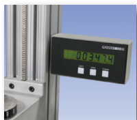
Indicateur d'angle numérique (TST001)