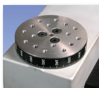
Plaque de fixation rotative